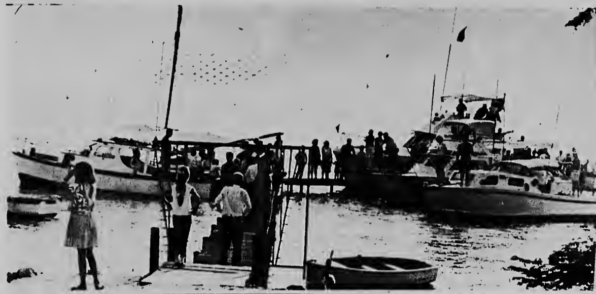
Diamars atardi a yega Aruba e yatenan cu a participa den e torneo di pesca na Venezuela, na unda e piscadornan di Aruba a haci un masha bon papel. Na nan yegada tabatin hopi hende na e pier riba L.G. Smithboulevard pa duna nan pabien y bonbini.